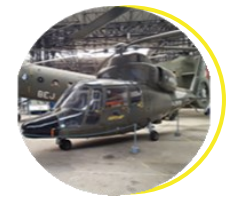
Musée de l'ALAT et de l'hélicoptère Dax