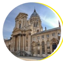
Musée du Service de santé des armées Paris