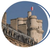
Service historique de la Défense Vincennes