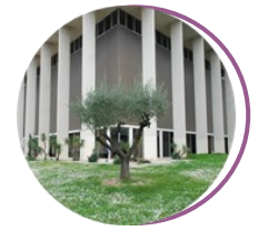
Musée de l'Artillerie Salle d'honneur de l'Infanterie Draguignan