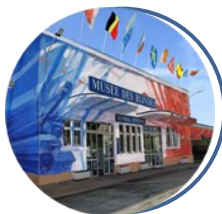
Musée des Blindés Saumur