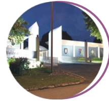
Musée-mémorial des parachutistes Pau