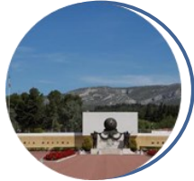
Musée de la Légion étrangère Aubagne