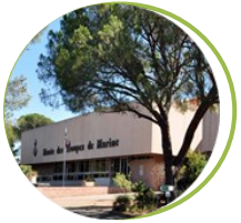
Musée des Troupes de marine Fréjus