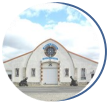
Musée du Matériel et de la Maintenance Bourges