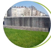
Mémorial des Martyrs de la Déportation Square de l'Île de France 75004 Paris www.cheminsdememoire.gouv.fr

Les neuf hauts lieux de la mémoire nationale, propriété de l'État, sont placés sous la responsabilité du ministère des armées. Ils relèvent de la Direction des patrimoines, de la mémoire et des archives (DPMA). Ces sites perpétuent la mémoire des conflits contemporains, depuis 1870 jusqu'à nos jours. Chaque haut lieu est emblématique d'un aspect de ces conflits. Tous marquent la volonté de l'État d'honorer ceux qui ont combattu pour la France ou qui ont été victimes des conflits dans lesquels elle a été engagée.