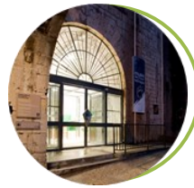
Musée des Troupes de montagne Grenoble