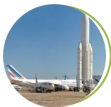
Musée de l'Air et de l'Espace Aéroport Paris Le Bourget