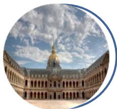
Musée de l'Armée Paris

Seize musées du ministère des Armées, lieux de culture et de patrimoine dans toute la France