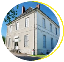
Musée du Train et des Équipages militaires Bourges