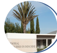
Mémorial des guerres en Indochine 862 Avenue du Général Callies 83600 Fréjus www.cheminsdememoire.gouv.fr