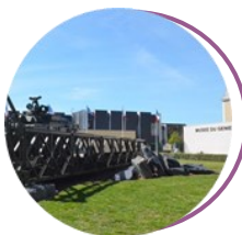
Musée du Génie Angers