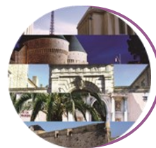
Musée national de la Marine Paris*, Brest, Port-Louis, Toulon, Rochefort (Hôtel de Cheusses et École de Médecine Navale)