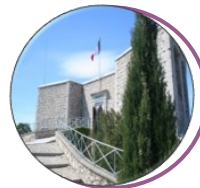
Mémorial du Mont Faron 8488 Route du Faron 83200 Toulon www.cheminsdememoire.gouv.fr