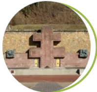
Le Mont-Valérien Avenue du Professeur Léon Bernard 92150 Suresnes www.mont-valerien.fr