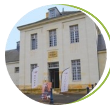
Musée de la Cavalerie Saumur