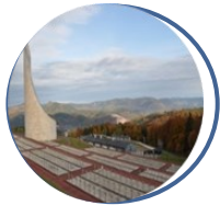
Centre européen du résistant déporté / Struthof Route départementale 130 67130 Natzwiller www.struthof.fr

Six des neuf hauts lieux de la mémoire nationale présentent leur programmation