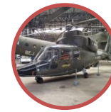
Musée de l'ALAT et de l'hélicoptère Dax