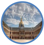
Musée de l'Armée Paris

16 musées du ministère des Armées, lieux de culture et de patrimoine dans toute la France