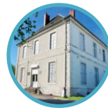
Musée du Train et des Équipages militaires Bourges