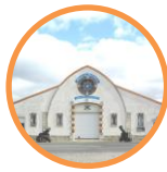
Musée du Matériel et de la Maintenance Bourges