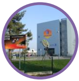
Musée des Transmissions Cesson-Sévigné