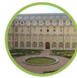
Musée du Service de santé des armées Paris