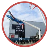
Musée de l'Air et de l'Espace Aéroport Paris – Le Bourget