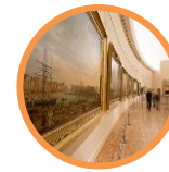
Musée national de la Marine Paris Brest Port-Louis Rochefort Toulon